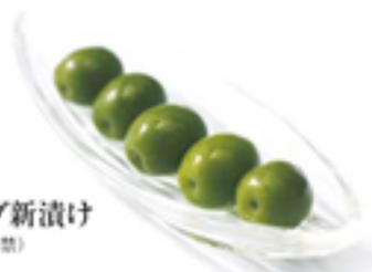
オリーブ新漬け (10月10日解禁)

1F 解禁日を待ち望むファンが多い「新漬け」は、緑色の若いオリーブを塩漬けたもの。ぷりっとかわいらしく、クセのない味に魅せられる人も多いとか。味も食べ方も漬物のようで、片手でつまんでポリポリかじって楽しめます。10月10日に解禁となり「特産品ショップ」で購入できます。その他、オイルやサイダーなどオリーブ関連商品も勢ぞろい。