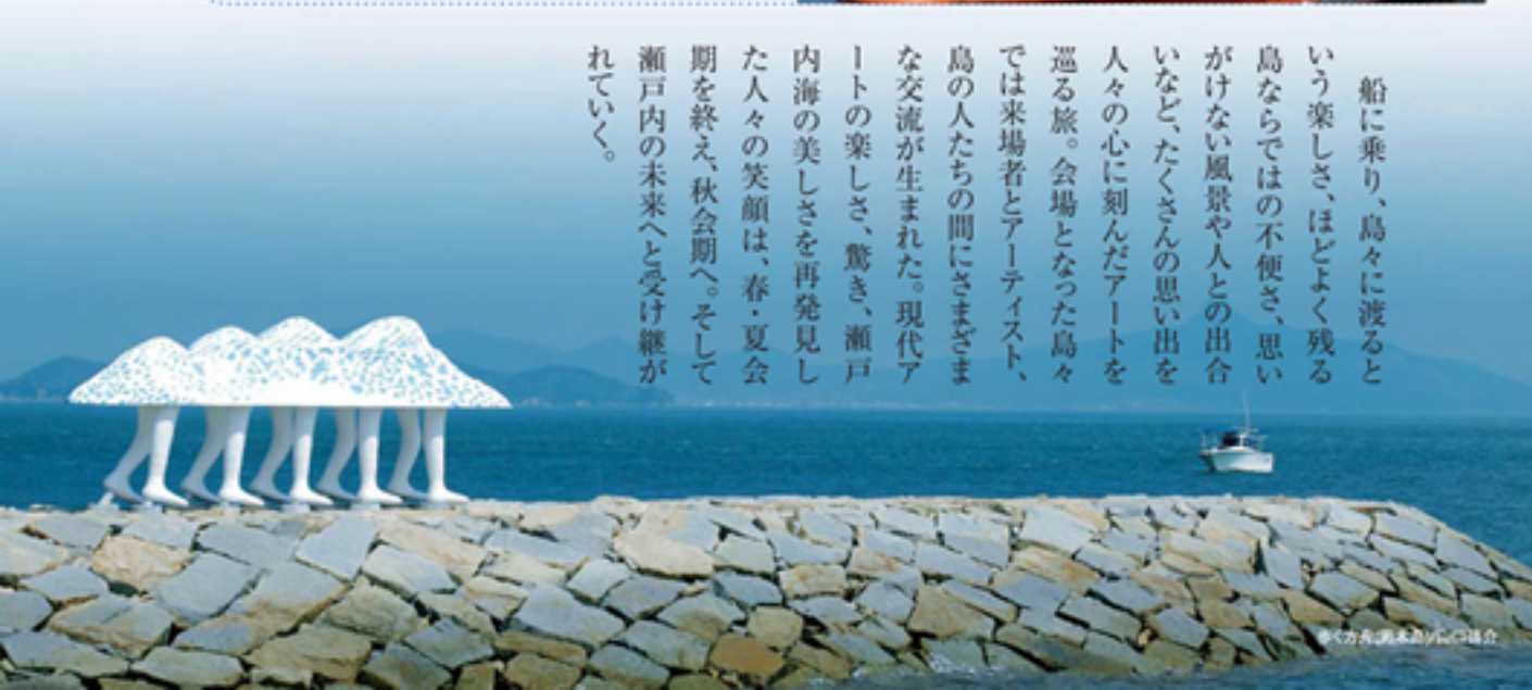
瀬戸内国際芸術祭2013