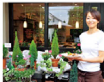
フラワーショップも併設。テラスで優雅にランチも。

香川県の自然も大変気に入ってくださり、香川のことを聞かれたら、どんな説明よりも「とにかく香川に行って体感してほしい」とおっしゃるとか。「あの瀬戸内海の島々、田んぼや豊かな自然は目からも癒され、