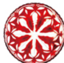
薩摩切子 紅色被屋 たのし日本美術 セントリー美術館コレクション 出品作品