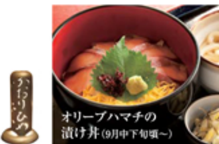
オリーブハマチの 漬け丼 (9月中下旬頃～)

2F オリーブをエサに育った「オリーブハマチ」や「オリーブ牛」は2階の「かおりひめ」でそれぞれ漬け丼、コロッケ・肉じゃがとして味わえます。脂が乗った深い味わいがありながら、あと味はすっきり。食欲の秋にもってこいの香川の秋の味覚をご堪能いただけます。